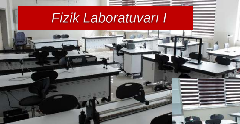
Fizik Laboratuvarı I