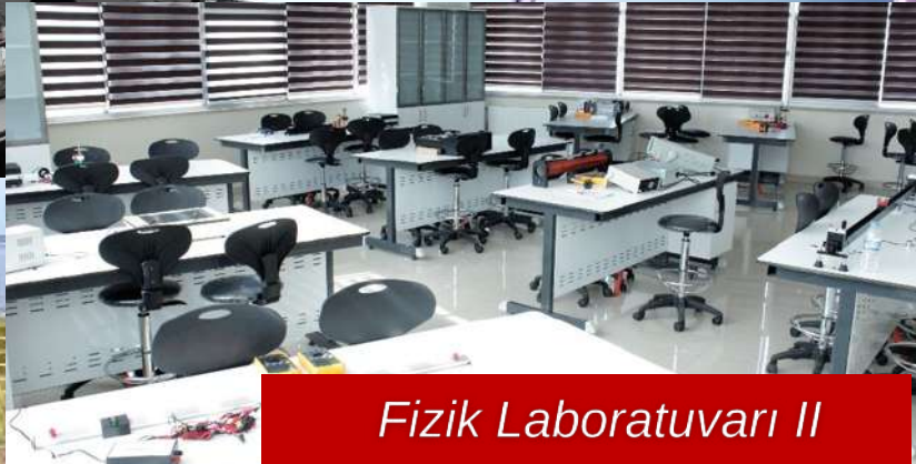
Fizik Laboratuvarı II